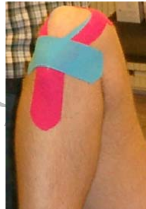
Behandlung von Knieschmerzen

Akute Sportverletzung (Ohne operative Indikation) HWS-Syndrom (muskuläre Hypertonie, Arthrose, Kopfschmerz) Schulter-Arm-Syndrom Cervico Brachialgie (TOS, Epicondylitis, Carpal-Tunnel-Syndrom) Korrektur der Bewegungsrichtung Neuro-reflektore Beeinflussung LWS-Syndrom (Rückenleiden, ISG-Blockierung, Ischialgien) Postoperative Nachsorge (VKB-Plastik, TEP, Sprunggelenk-OP, Achillessehnennaht) Impingement-Syndrom Skoliosen Schulterluxation Arthrose Tennisarm Gelenkdistorsionen Spastiken Lähmungen Polyneuropathie Harninkontinenz Dysmenorrhoe Lymphödeme Migräne