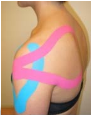
Behandlung von Schulterschmerzen

Die liftende Wirkung des Tapes ergibt eine sofortige Druckverminderung, wodurch der Blutkreislauf und die Lympheabfuhr wiederhergestellt werden. Der Druck auf die Schmerzrezeptoren nimmt ab, der empfundene Schmerz vermindert sich sofort.